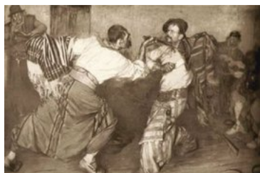
« Le Duel chez Les Gauchos », Pampa Argentine